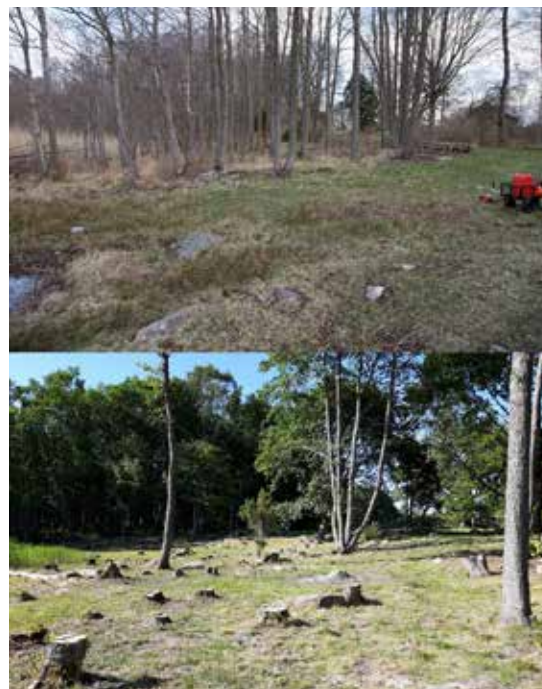
Före och efter restaurering av området söder om kyrkoruinen.