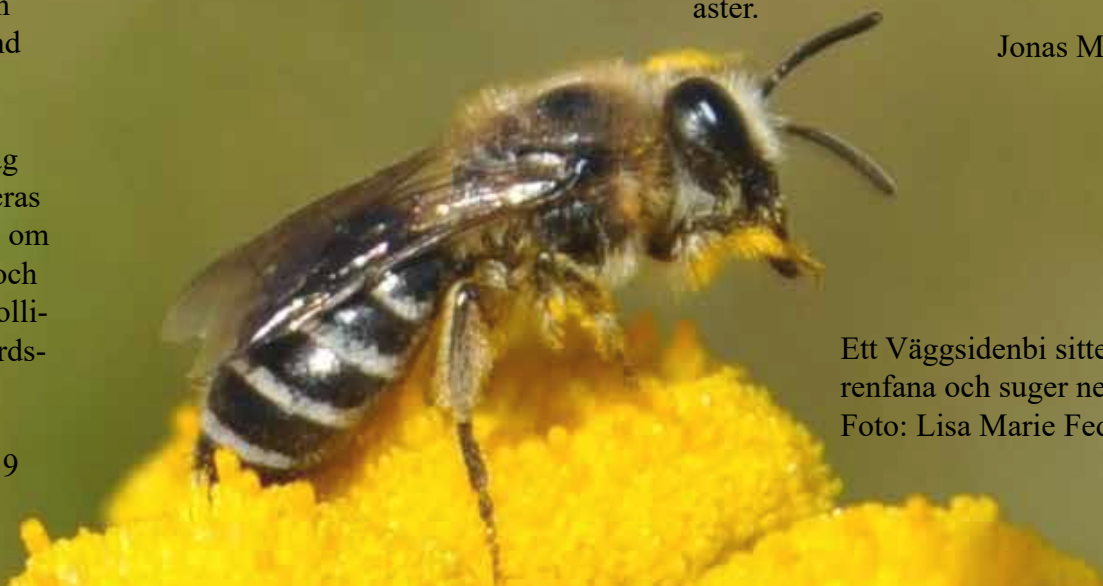
Ett Väggsidenbi sitter på en renfana och suger nektar.