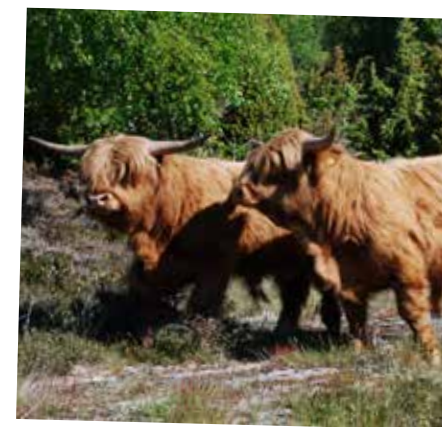
Betande Highland cattle.

Infaller i år 26 augusti till den 3 september. Kolla in www.vanerveckan.se för mer information om vad som händer i närheten av dig! En av aktiviteterna är båtutture till Djurö.