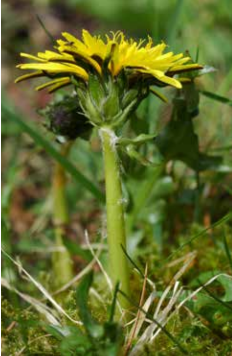
Nordstedts maskros

Färden gick mot Lurö och vid landstigning på Stenstaka kunde vi studera flera olika maskrosor. De tog kollekt (dvs. samlade in ett exemplar som senare skulle skickas för artbestämning hos en riktig expert) och dokumenterade omgiv-