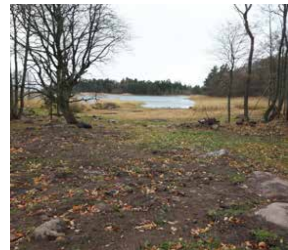
Början av november 2016. Klost- rängen med blottlagd jord i förgrun- den och nedröjd vass i bakgrunden.