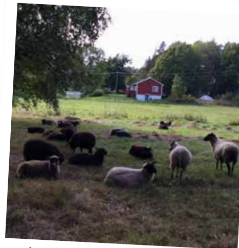
Fåren betar på Stenstakaängen