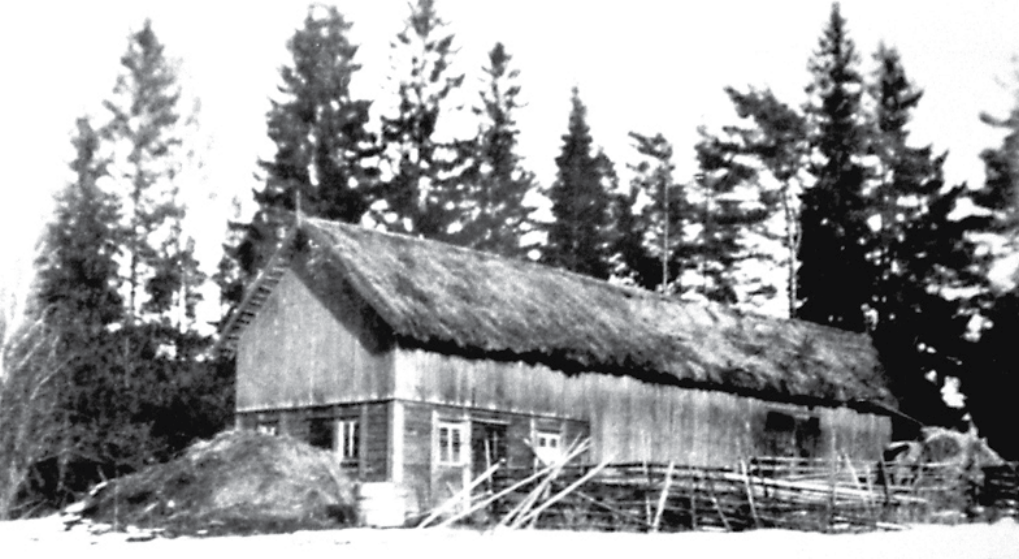
Fotot är taget på 1940-talet och visar den ladugård som en gång fanns på Bärön.