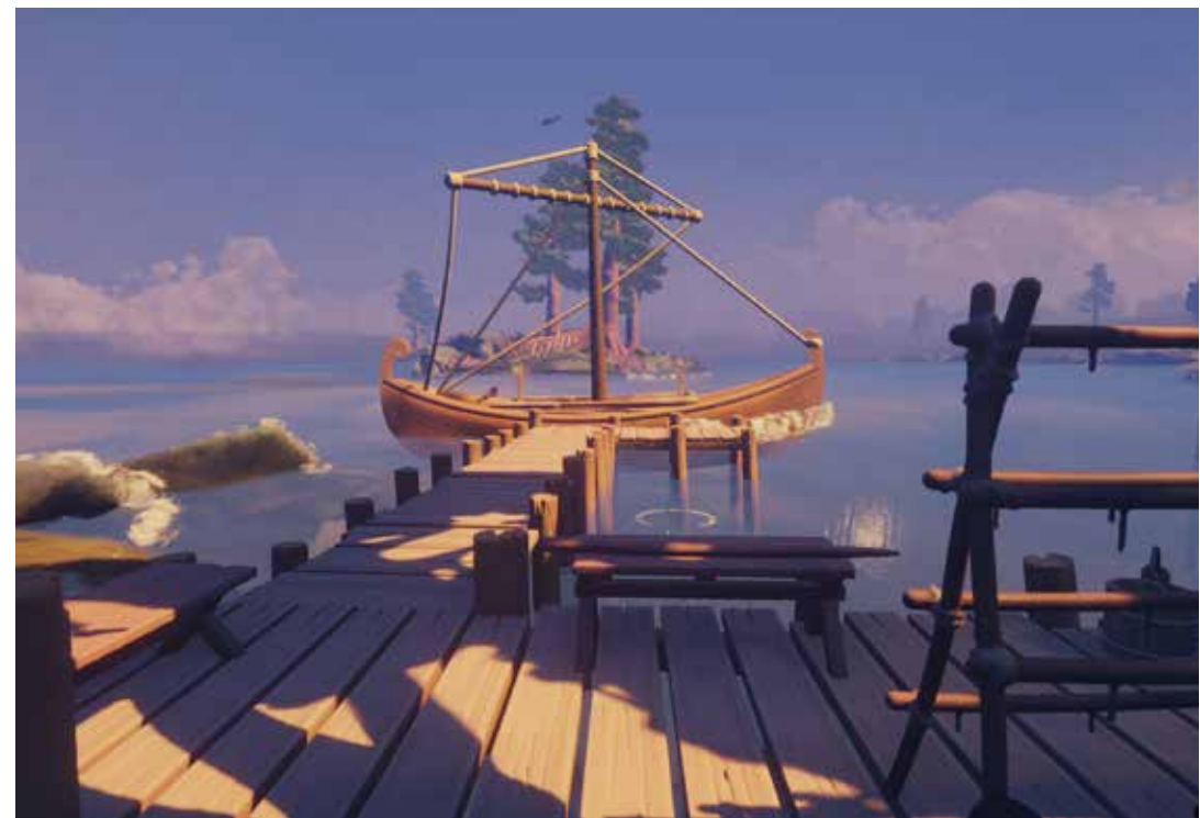
Premiär av VR-spelet på Värmlands Museum i Karlstad.

lösning för spelet, som bland annat (i teorin) skulle kunna besöka Lurö ö i sommar tillsammans med fler platser runtom i Värmland och inte minst finnas på museet under den vardagliga verksamheten för alla att testa. Att som producent, spelutvecklare, (samt manus-och röstskådespelare) fått se denna högst lokala produktion gå från frö till ax - idé till verklighet har varit en av de hittills mest spännande upplevelserna i mitt yrkesverksamma liv. Jag hoppas innerligt att fler ska få ta del av vår skapelse och genom den bli nyfikna på att upptäcka mer om det Lurö som var och det Lurö som är idag. För tro mig - det är minst lika häftigt att vara där på plats som inne i spelupplevelsen (om inte häftigare). Augustiveckan år 2022 kommer för mig bli ett minne för livet liksom hela denna spelutvecklingsresa - som ännu bara börjat.