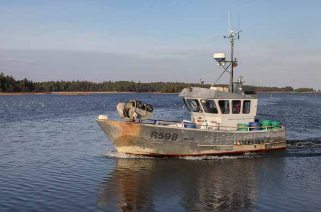
Yrkesfiskarna blir allt färre i Vänern.