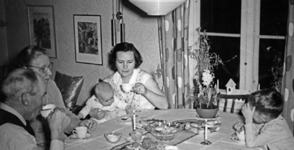
Helger och lov betyder gemenskap och samvaro med familjen.