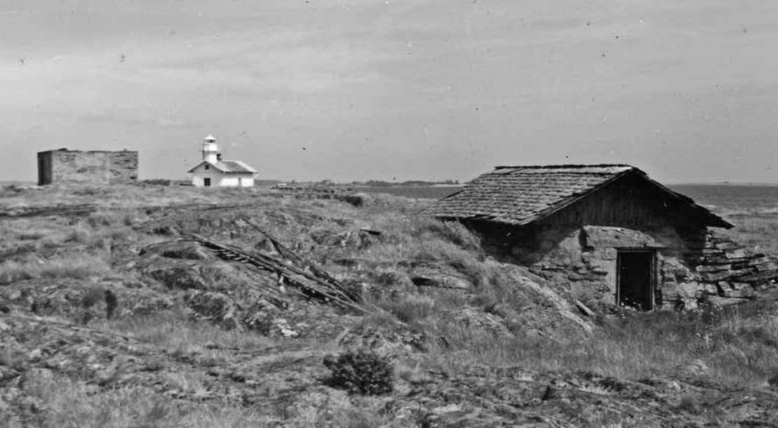
Gunnarsholmens fyr i bakgrunden med jordkällaren till höger. Detta foto är från år 1964.