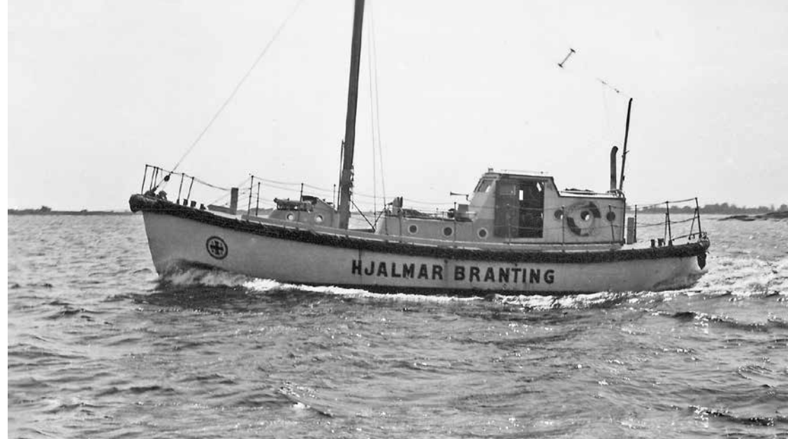
Sjöräddningssällskapets räddningsbåt Hjalmar Brantning år 1964.

Med utbyggd satellitnavigering har fyrarnas betydelse minskat. Allt fler fyrar släcks idag ner. En ”upplöst” kulturhistoria försvinner.