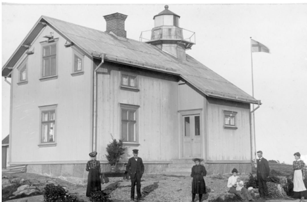
Stånguddens fyr, fotot är från år 1905 när nuvarande fyrhuset är nybyggt.