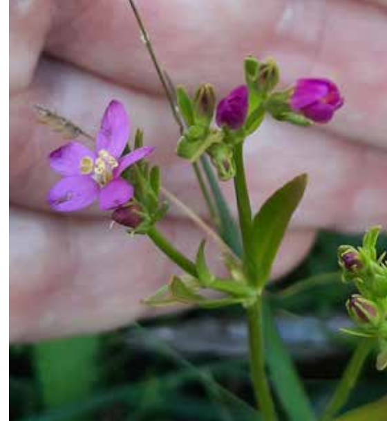
Nya fyndet av Kustarun.

Jag har årligen de senaste tio åren sökt ytan för att eventuellt återfinna den, utan att lyckas. Strandängen har en rik flora på andra arter varvid skötsel är nödvändig för att bibehålla artsammansättningen. Slåtter är att föredra även om ängen både historiskt och i nutid betats. Kustarun kan missgynnas av bete eftersom blomningen sker sent på säsongen och givetvis blir ett lätt byte för en kossa. Samtidigt ger bete förutsättningar för dess förekomst (annars växer marken igen).