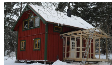
Från sommar till vinter, Ekhaga 2011