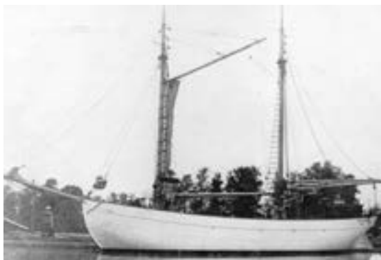
Nybyggda Ingan i Sjötorp 1928.