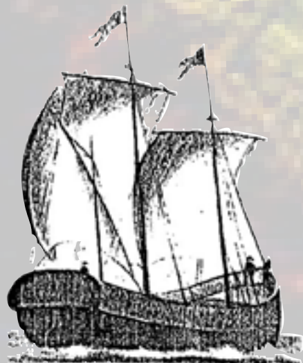
Blockskuta från 1700-talet avbildad i kyrka på Kinnekulle.

Någon form av sjöfart har säkert bedrivits på Väneren så länge det bött människor i området. På gund av frånvaron av städer under medeltiden tros trafiken delvis ha bestått av det man brukar kalla allmogeseglation. Men förutom detta finns starka teorier om att den stora kyrkoetableringen runt om Väneren, som skedde under samma tid, kan ha inneburit ett högre organiserat redande där enorma mängder kalksten skeppats ut från Kinnekulle till hamnar runt om sjön. Efter städernas tillkomst skapades konkurrensförhållande och den så kallade bondeseglationen och småredandet tog fart inom lämpliga nischer. Värmland och Dalsland gav generellt sett timmer och järn, medan Västergötland bjöd på spannmål och kalksten. Man fraktade även stångjärn ut till Västerhavet men då via landvägen förbi forsarna i Trollhättan.