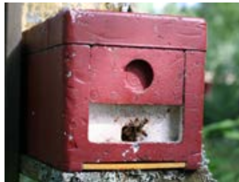
En av Lurös parningskupor där drottningen kan flyga ut och paras för att sedan börja lägga ägg.

Detta ledde fram till att Projekt NordBi bildades 1990. Nu gjordes en stor satsning med att inventera hela landet och starta avelsverksamhet på bin som verkligen var rena nordiska bin och inga blandbin med inslag av importerade raser. Nyfikenhet och svaghet för det utländska gäller inte bara bin, men införsel av nya raser av bin har haft dramatiska effekter. Bidrottningen parar sig med ett 20-tal