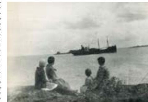
Utblick från Stångudden ut över farleden och Trädgårdsholmens fyr.