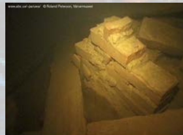
Murad eldstad i förens skans, vraket i Gubbens Hôla.