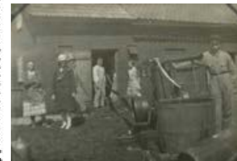
Här mals säden i kvarnen "fram på Lurö", Basteviken.

Ur fem gamla släktalbum hittades flera fina fotografier från Lurö, här är ett axplock av de bilderna.